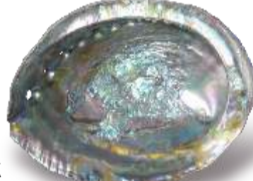
CONCHIGLIA BLU DEL PACIFICO. PADRE KINO INTUÌ LA PENINSULARITÀ DELLA BASSA CALIFORNIA GRAZIE AL RITROVAMENTO DI QUESTE CONCHIGLIE TRA LE POPOLAZIONI DELL'ENTROTERRA, NONOSTANTE ESSE NON PRATICASSERO LA NAVIGAZIONE.

valorizzazione di questo grande portatore di civiltà e speranza; un percorso che ora, a trecento anni dalla morte avvenuta a Magdalena de Kino, pone ancora una volta la figura del Padre gesuita al centro di una serie di iniziative che, sia nei luoghi delle sue missioni, sia in quelli che gli hanno dato i natali, intendono far conoscere e commemorare l'opera e la memoria.