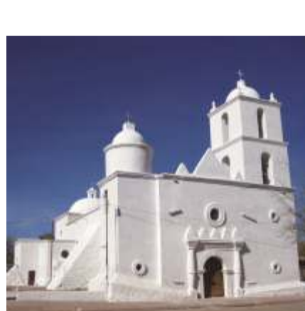
MISSIONE DI SAN IGNACIO