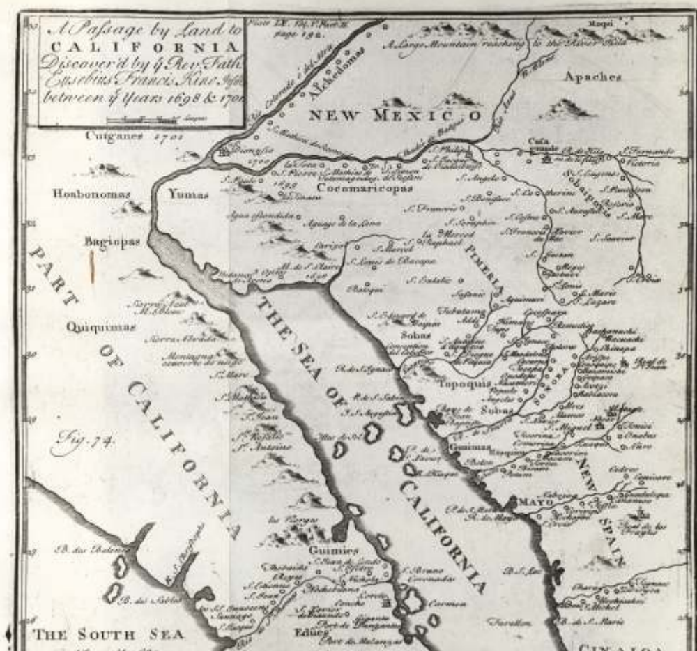
TAVOLA DELLA CALIFORNIA TRACCIATA DA PADRE KINO NEL 1702