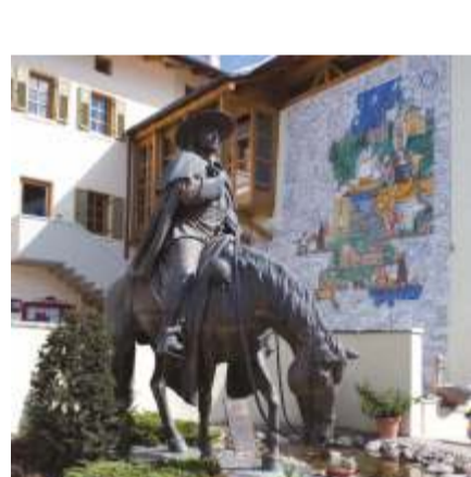
MUSEO DI SEGNO DEDICATO A PADRE KINO