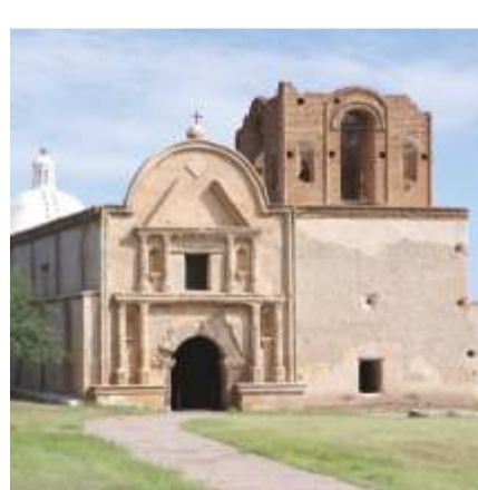
MISSIONE DI TUMACACORI